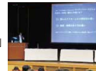
講演「コンテンツ・ツーリズムとは何か」

2月 ●【尚綱地域連携推進センター】 「熊本から考える コンテンツ・ツーリズムの可能性」 パネルディスカッション開催