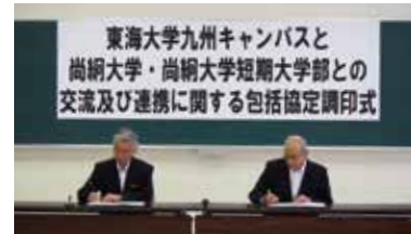
東海大学九州キャンパスとの調印式

●【大学】 トビタテ留学JAPAN「地域人材コース」に 2名採用(文化言語学部)