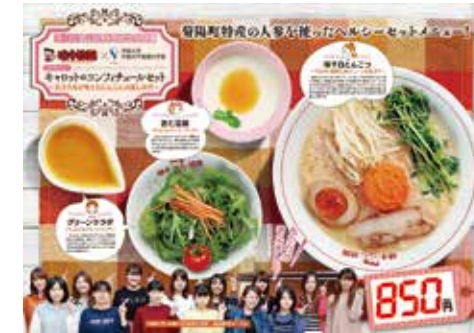
菊陽町特産のニンジンを使ったコラボメニューを 味千ラーメンで販売(2018.11月～3月)

●【尚綱食育研究センター】 味千ラーメンとのコラボメニュー「キャロットのコンフィチュールセット ～女子大生の考えたにんじんの楽しみ方～」販売