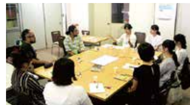
気軽に話せる集いの場「保育Café」