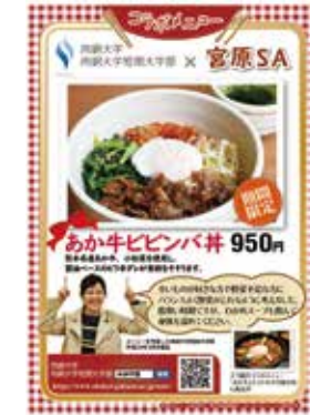
「あか牛ビビンバ丼」