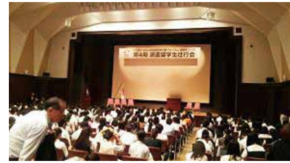
トビタテ!留学JAPAN日本代表プログラム 事前学習会及び壮行会

●【高等学校】 トビタテ!留学JAPAN日本代表プログラム高校生コース第4期派遣留学生選抜