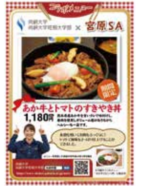
「あか牛とトマトのすきやき丼」

●【尚綱食育研究センター】 西日本高速道路サービス・ホールディングス(株)九州支社、 九州産交リテール(株)とのコラボメニュー開発