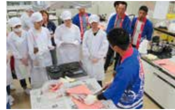
魚のさばき方<郷土料理教室>

7月 ●【大学・短大】 東海大学九州キャンパスとの 交流及び連携に関する包括協定締結