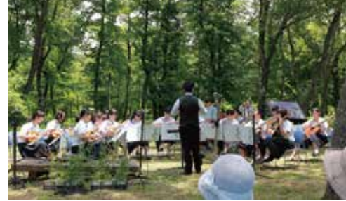
野の花コンサート～はなしのぶ～

【高等学校】 休暇村南阿蘇「阿蘇野草園」 第1回みなみ阿蘇 「野の花コンサート～はなしのぶ～」開催 ギター・マンドリン部演奏