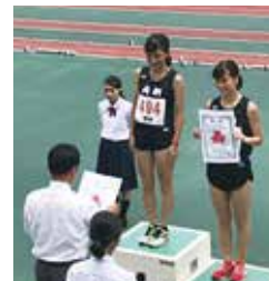
陸上女子5000m競歩優勝

8月 ●【高等学校】 平成30年度全国高等学校総合体育大会(インターハイ) 陸上女子個人5,000m競歩優勝