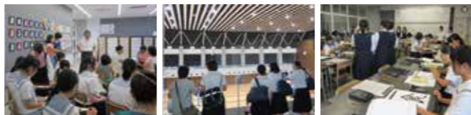
内容:学校紹介、授業体験、部活動体験・見学など