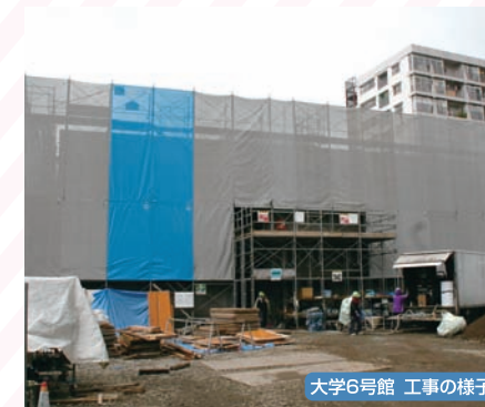
大学6号館 工事の様子