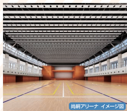
尚綱アリーナ イメージ図