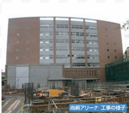
尚綱アリーナ 工事の様子