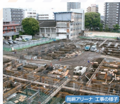
尚綱アリーナ 工事の様子