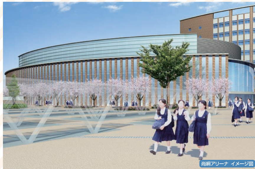
尚綱アリーナ イメージ図