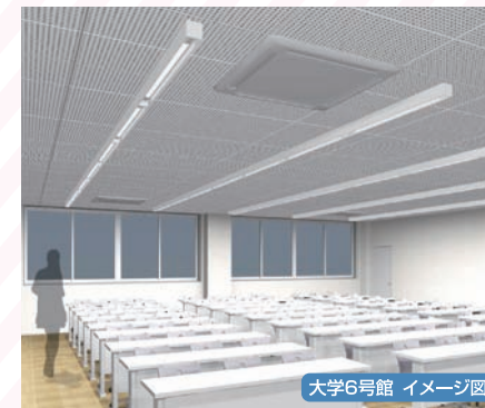
大学6号館 イメージ図