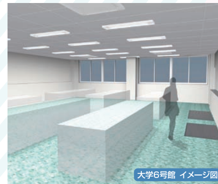
大学6号館 イメージ図