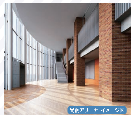
尚綱アリーナ イメージ図