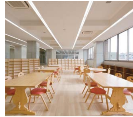
2F 図書室(中学・高校)