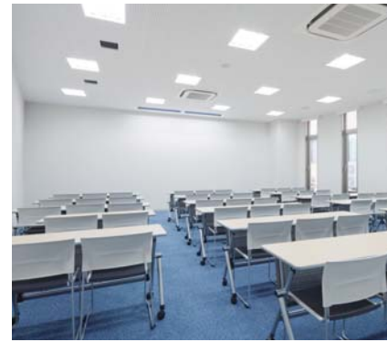
1F 大学図書館(グループ学習室)