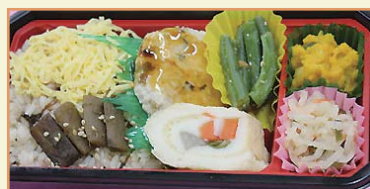
写真上:開発会議の様子 写真下:美肌弁当(1/27発売)