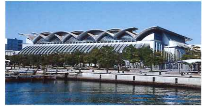
マリンメッセ福岡A館

■会 場：●ウォーターフロントエリア(マリンメッセ福岡A館等) ●シーサイドももち海浜公園 など