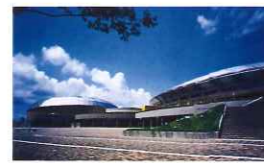
アクアドームくまもと