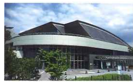
総合西市民プール