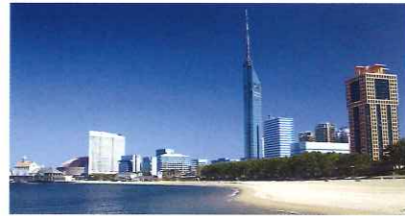
シーサイドももち海浜公園