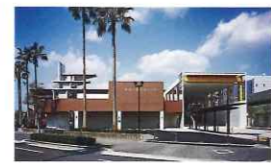
鴨池公園水泳プール