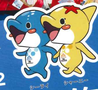
シーライ シヤムー