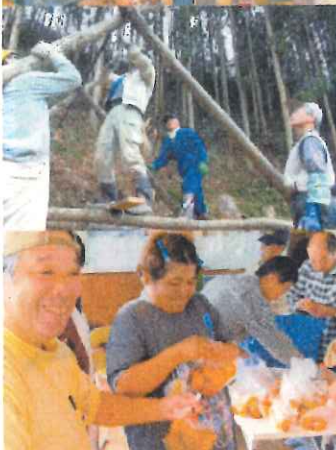
監督:森康行 ナレーター:山根基世

企画:田中幸子、横山哲平 プロデューサー:藤田徹、川邊晃司 プロデューサー:東北担当:小澤真 撮影:野間健、古賀陽一 編集:古賀陽一 音楽:平野晶子 音楽プロデューサー:八重樫健二 録音:引間保二 製作著作:日本労働者協同組合(ワーカーズコープ)連合会センター事業団 配給:一般社団法人日本社会連帯機構、日本労働者協同組合(ワーカーズコープ)連合会 配給宣伝協力:ウッキー・プロダクション 2018年 | 89分 | HD | 16:9 | カラー | 日本ドキュメンタリー