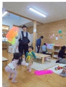
フワフワ飛ばしてあそぼ♪