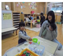
粘土で何を作ろうかな?