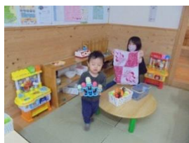
ぼくはおいしいアイス屋さん!!