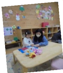
おかあさんと凧を作ったよ