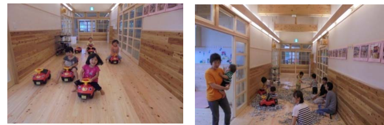
雨の日は、廊下も子どもたちの遊び場です！！