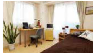
ドミー熊本 熊本市中央区大江5丁目17-27 ※詳細については学園事務局までお尋ねください。

尚綱学園九品寺キャンパスまで、徒歩約11分、自転車約5分の場所にある「ドミー熊本」。7階~9階までを本学園の生徒・学生専用の寮として通常よりも格安にて入寮が可能。生活必需品完備、朝・昼(弁当)・夕食付、寮長夫妻常駐など、初めての一人暮らしにも安心です。