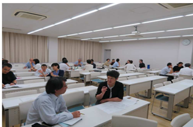
グループディスカッション