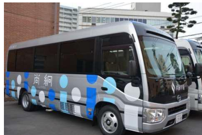
2 号車 (シルバー)