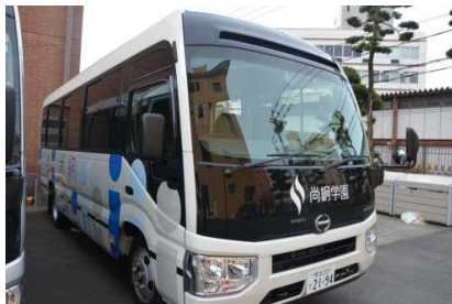
1 号車 (白色)

利用申請書の提出は必要ありません。 当校生徒であれば自由に乗車できますが、大学生、教職員も利用しており、乗車定員は 28 名までです。