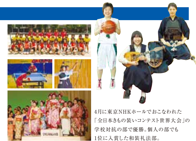
4月に東京NHKホールでおこなわれた「全日本きもの装いコンテスト世界大会」の学校対抗の部で優勝。個人の部でも1位に入賞した和装礼法部。